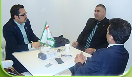
آرمان سبز ، راز سرزمین